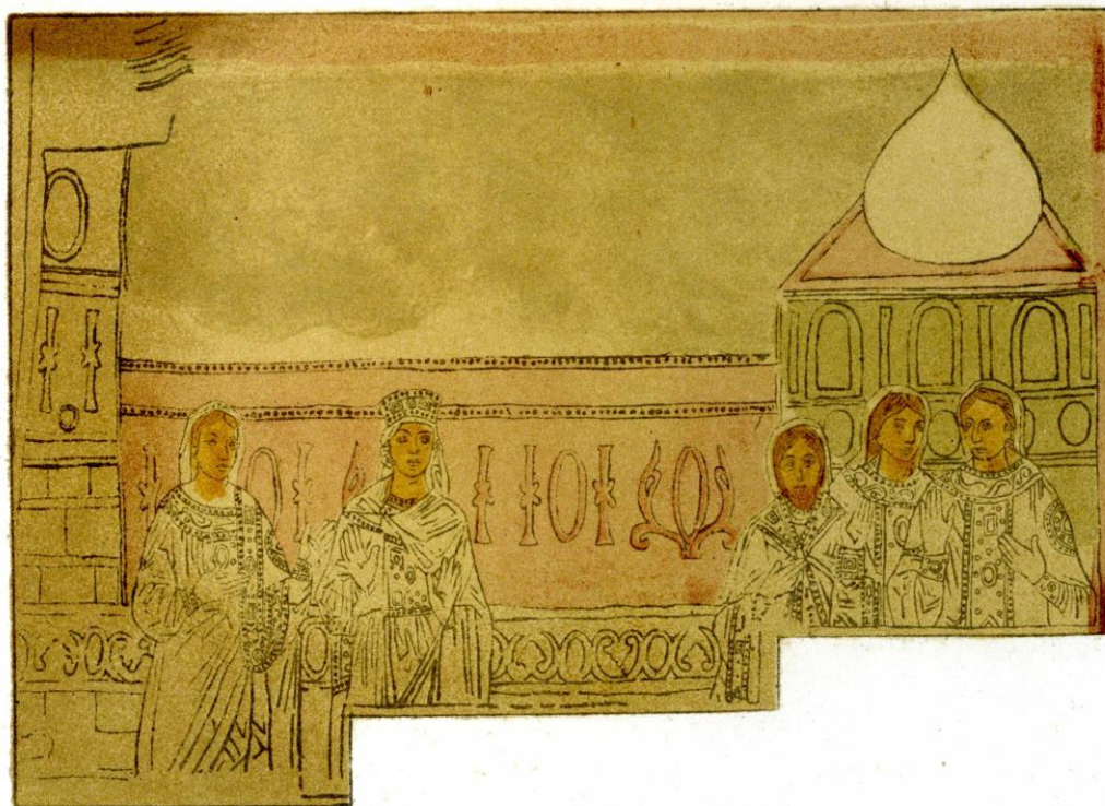
Коронаційний вихід принцеси Анни. Малюнок з фрески XI ст. у північній вежі Софії Київської. Ф. Солнцев. Середина XIX ст.