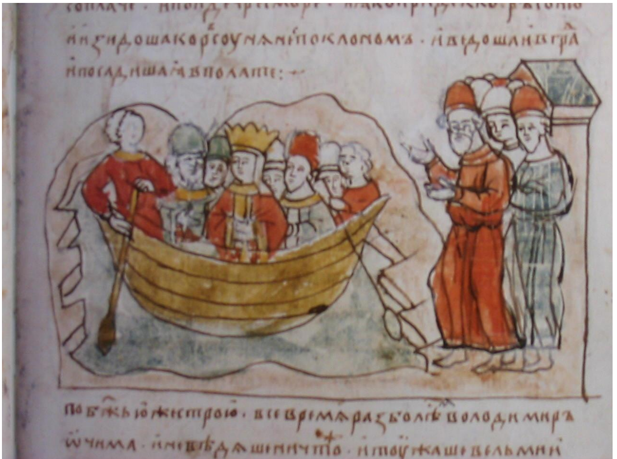
Прибуття Анни в Корсунь. Мініатюра Радзивілівського літопису. XV ст.