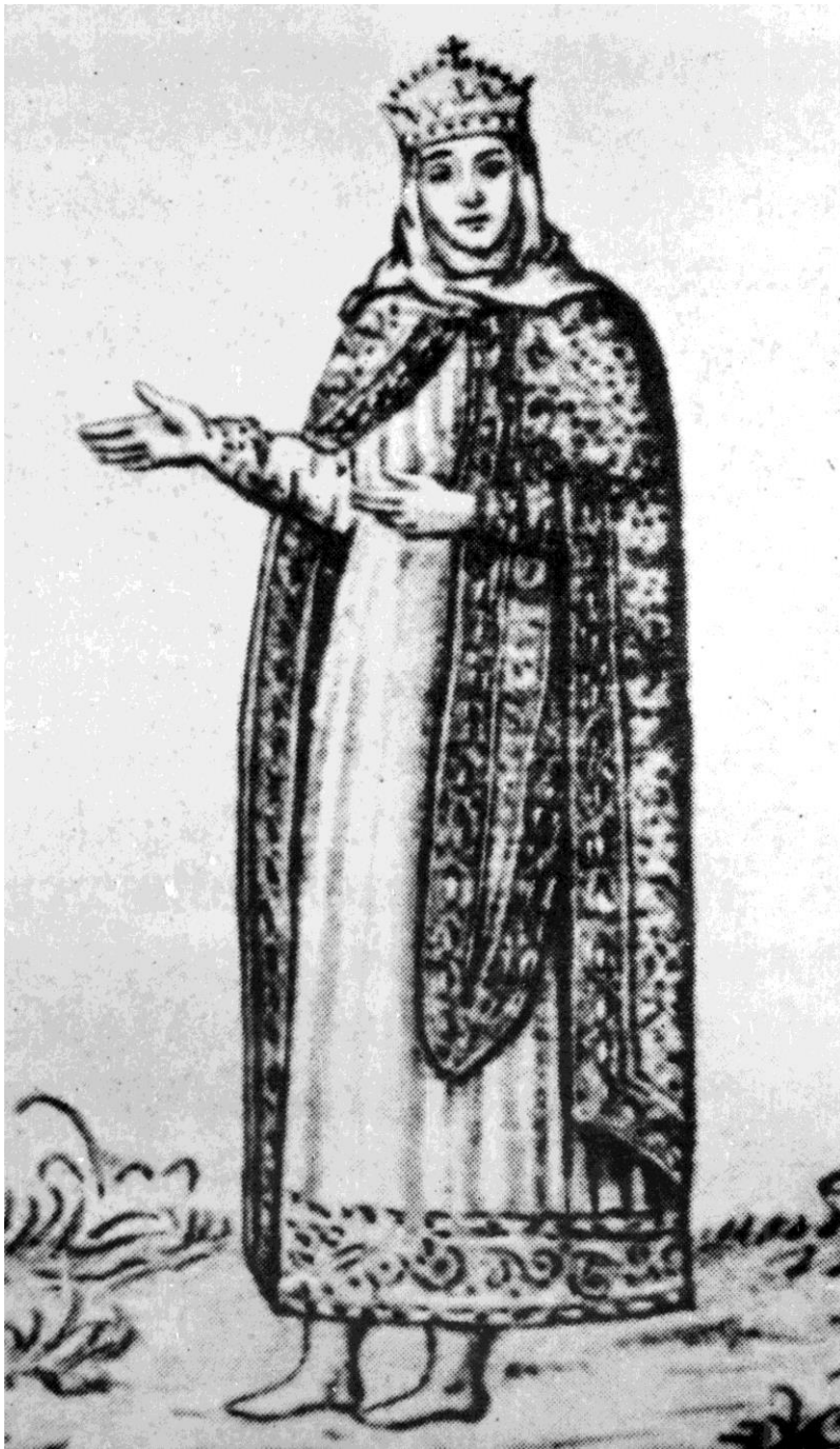
Княгиня Анна на княжому портреті в центральній наві Софії Київської. Малюнок з фрески XI ст. А. ван Вестерфельд. 1651 р.